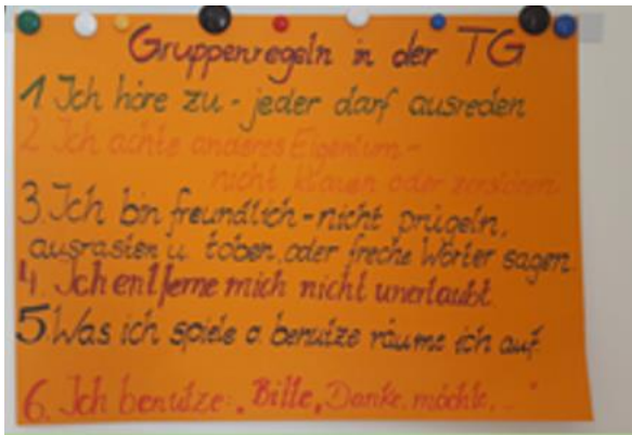
Unsere Grundregeln in der Tagesgruppe

Wir betreuen bis zu 8 Kinder von 6 - 12 Jahren halbtags nach der Schule und in den Ferien von 9 - 15 Uhr. Bei uns werden die Kinder mit Tagesstrukturen vertraut gemacht, wir begleiten den Schulalltag und unterstützen Eltern bei der Entwicklung der Erziehungskompetenzen mit dem Ziel das familiäre System zu erhalten und zu stärken.